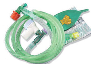
XV913416 + XV923073