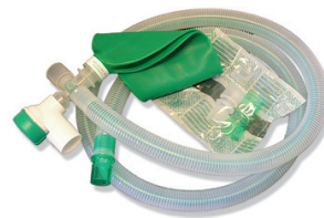
XV913415 + XV1281102